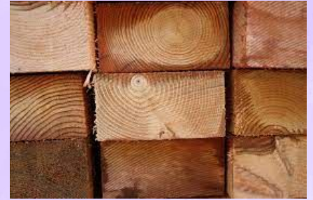
Madera de cedro