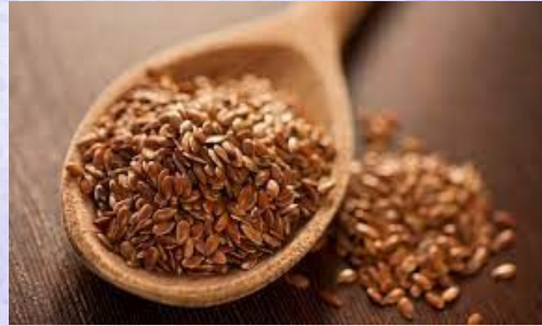
Semillas de lino